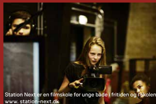
Station Next er en filmskole for unge både i fritiden og i skolen www.station-next.dk